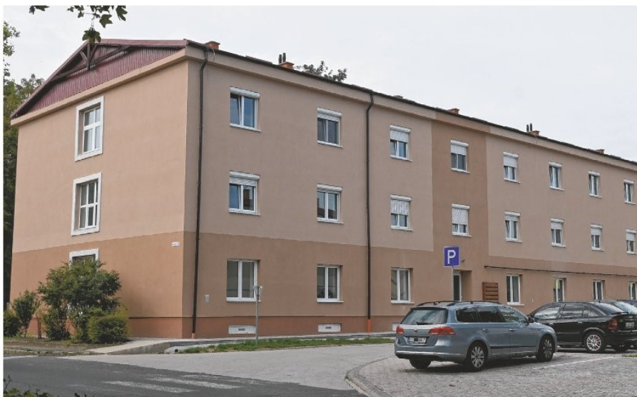
A teljeskörűen felújított társasház